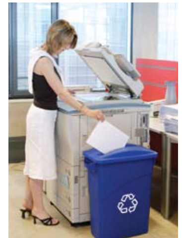
Contenedor 3541-73 con Tapa 2703-88