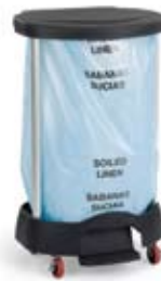
6300 (La bolsa mostrada no está disponible a la venta)