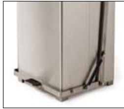
TAPA CONTROLADA POR UN AMORTIGUADOR Cierra silenciosamente