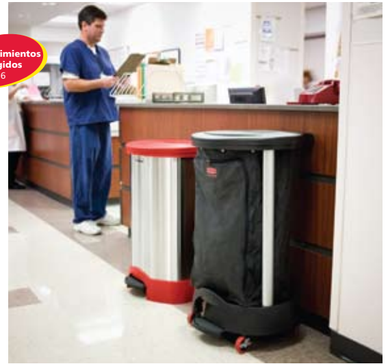
6146-87 / 6300 / 6350