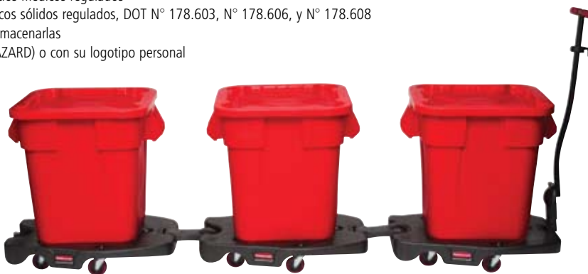
3517 / 2651-03