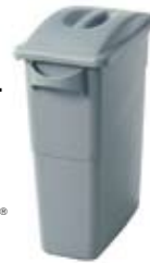
Combo Slim Jim® 3542-20

Disponible en múltiples colores para simplificar la separación de los desperdicios