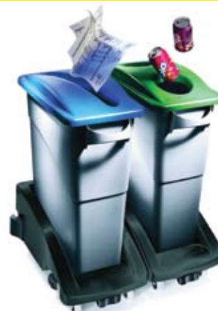
3551-88 con 3542-20 / 2703-88 / 2692-88