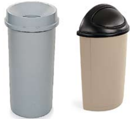
3548 / 3546