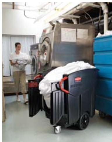
Puertas traseras para fácil remoción del contenido.