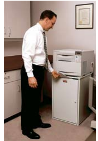
9W17 con copiadora encima