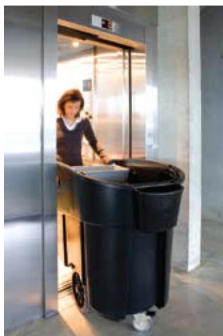
Cabe en la mayoría de las puertas y elevadores.

Ruedas grandes de 30.5 cm y ruedas giratorias de 12.7 cm en patrón de diamante y con mecanismos de bloqueo que no dejan marcas, permiten girar el Mega BRUTE® en su propio eje.