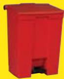
Contenedor de Pedal "Step-On" pag. 21