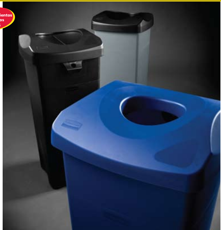
3569-88 / 2689-88