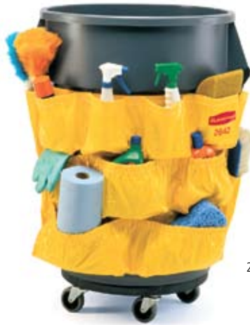
2643 / 2642 / 2640

*Herramientas y accesorios se venden por separado.